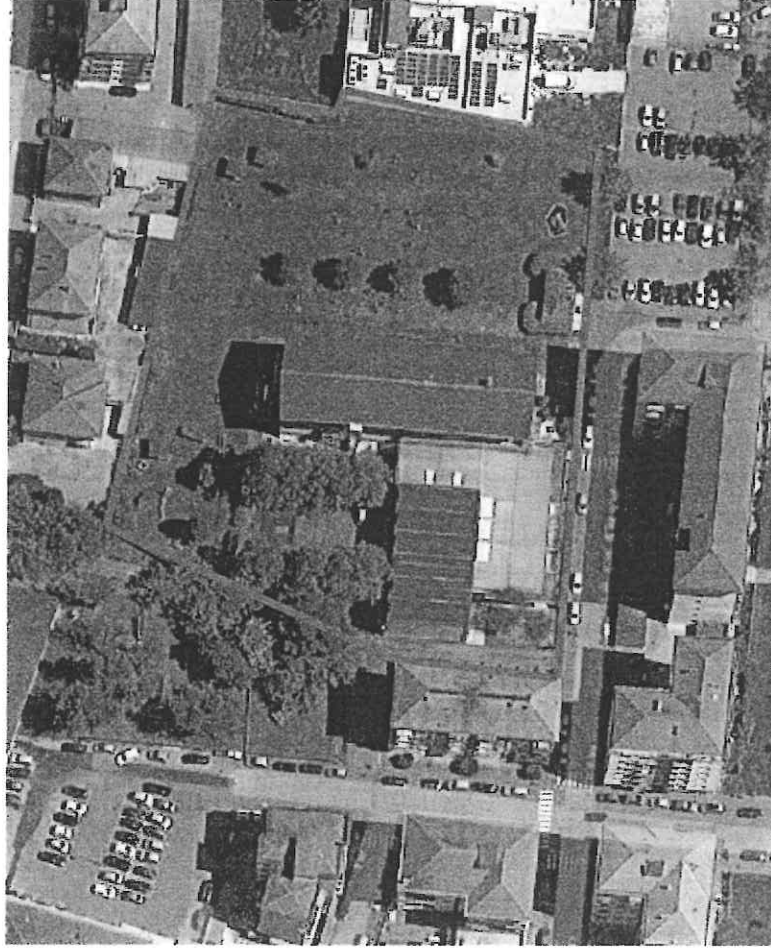
Scuola Elementare "Bistolfi"